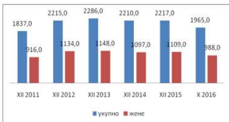
Графикон 1 - Број незапослених лица у периоду 2011. - 2016. године на територији ГО Барајево, по полу