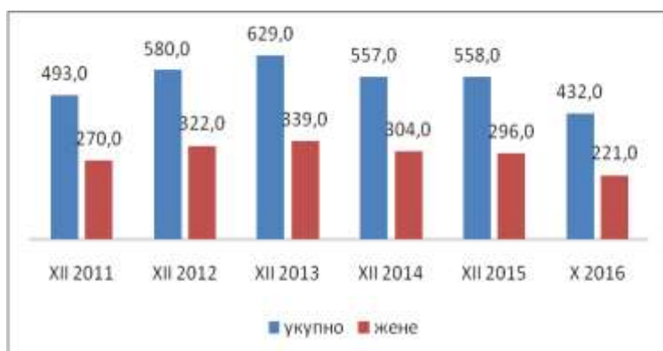
Графикон 2 - Број незапослених лица старости до 30 година у периоду 2011. - 2016. године на територији ГО Барајево, по полу